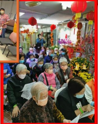
2024年老人院賀年活動