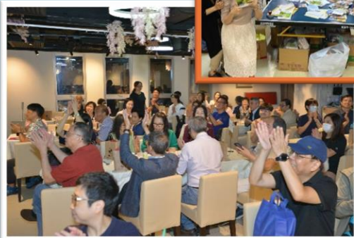
2023年 愛得有營夫婦餐會