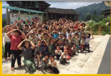
2016年 和平城 短宣